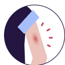
Bol na mestu ubrizgavanja

Ovi simptomi obično nestaju nakon nekoliko dana. Ako su ovi simptomi trajni ili se pojave drugi atipični simptomi, obratite se svom porodičnom lekaru.